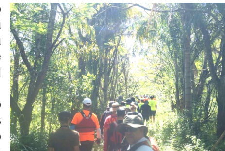
Pelas trilhas da Ilha

O interesse pelas palestras gera também o interesse por visitar a Ilha Brasileira, o Parque Rincón de Franquia no Uruguai e outros atrativos de nosso ambiente. Em dezembro, 40 alunos de biologia de Alegrete irão conhecer a Ilha Brasileira.